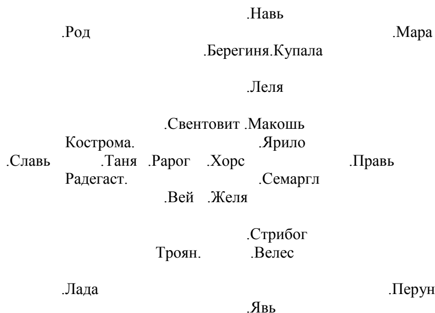
Рис. 1 Звезда Ра.

Из полученного магического квадрата легко вытекает дошедшая до нас звезда Сварога, которую иногда называют ещё звездой Перуна (рис.5). Она была голубой, видимо поэтому арии связали Сварога с названием неба - "сварга", хотя другое значение этого слова у индусов - "Рай Индры" (Индра - один из главных богов индуизма). Звезда Сварога имеет ровно 24 пересечения (точки), что позволило нашим предкам разместить на ней весь русско-борейский божественный Пантеон, а в центре поставить 25-ю точку, принадлежащую Сварогу-Создателю.